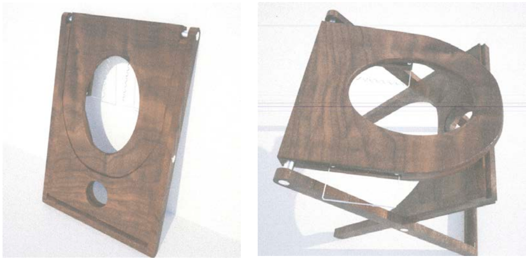
図4 プラスチック製ポータブル尿尿分離トイレ

活動開始数か月後には現地での緊急トイレのニーズはほぼ終息してきたため、現地での緊急用途としてのトイレ導入活動から、余震も含めた今後の備えとしての機能を高めるため、トイレの改良・普及・商品化に向けた活動に移行していった。2011年9月には大津市総合防災訓練にて本トイレのデモンストレーションを行ったが、行政・市民団体共に関心が高かった。緊急のトイレ問題がほぼ終息した2011年11月には、石巻市専修大学ボランティアセンター、石巻市役所1階スーパー、女川ボランティアセンター、石巻市日和山公園視、多賀城市ショッピングセンターを訪問し、本トイレのデモンストレーションを実施し配布した。