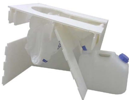
図1 プラスチック段ボール製ポータブル尿尿分離トイレ断面写真

水産試験場，同・気仙沼保健所，同・気仙沼地方振興事務所訪問，気仙沼市総務部危機管理課訪問，気仙沼市本吉総合支所訪問，気仙沼市本吉地区被災状況視察，東北大学環境科学研究科エコラボ訪問を行うと共に，本トイレのデモンストレーションを行い，上記各所に配布した。さらに気仙沼市内の2か所の保健施設にてデモンストレーションを行い，本トイレを配布すると同時に，震災後のトイレ事情に関する聞き取り調査を実施した。これらをもとに，より多くの人を受け入れられ容易に備蓄できるようにポータブル尿尿分離トイレを改良・再考した。この結果，最終青果物として，プラスチック段ボール製 {図1，図2}、硬質ミルダン（牛乳パック再生段ボール紙）製（図3）、プラスチック製の3種類のポータブル尿尿分離トイレ（図4）が完成した。