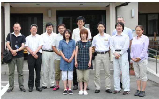
図 6 気仙沼の医療機関前にて機関職員と実装メンバーで

もしれない。また、いざという時に水に頼らない尿尿処理システムを地域で確保する新たなアプローチとして、災害時に避難所となるいずれかの公共施設などで常設型の尿尿分離システムの先行導入を探る。こうした平時のからの備えを継続することで、災害に対応できる尿尿処理下水道システムへのパラダイムシフトを目指す。