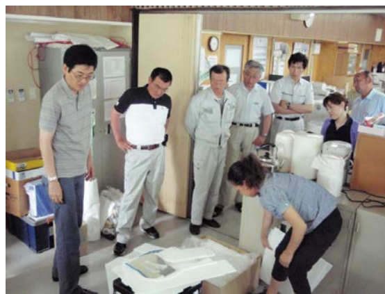
図 7 ポータブル尿尿分離トイレのデモンストラレーション