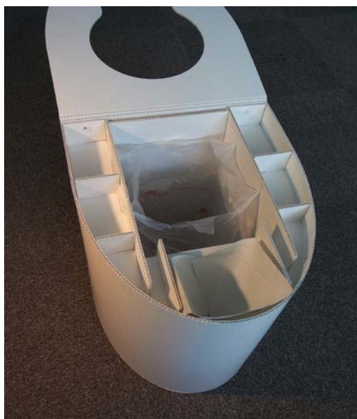
図3 硬質ミルダン（牛乳パック再生段ボール紙）製ポータブル尿尿分離トイレ