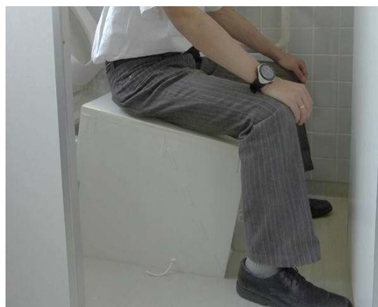
図2 洋式トイレに設置したプラスチック段ボール製ポータブル尿尿分離トイレ