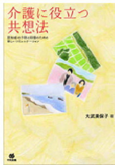
図 4 共想法に関する世界初の書籍

一連の実施を通じて得られた知見と実施手順を、共想法に関する世界初の書籍としてまとめ、今後の展開に向けた基礎ができた(著作物 5、図 4)。