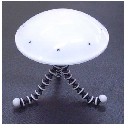
図 2 無線型音源定位装置

認知活動介入支援システムとして、発話量と笑顔度に基づいて、話者交代を支援するシステムを開発した(論文 3)。発話量のばらつきをモニタリングしながら、参加者全体の笑顔度が下がったタイミングで、発話量が多い参加者の発話を抑制し、発話量が少ない参加者に発話を促すことで、会話の盛り上がりを損なわずに、発話量のバランスを取ることに成功した。この他、企業と共同で、発話量計測を非接触で行うことができる無線型音源定位装置(図 2、プレスリリース 2)や、会話支援ロボット(図 3)を開発することに成功した。