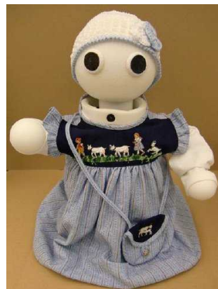
図 3 会話支援ロボット